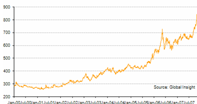
Gold price, dollar per ounce, London PM fix