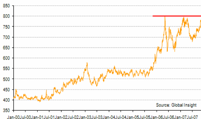
Gold price, Canadian $ per ounce, London pm fix