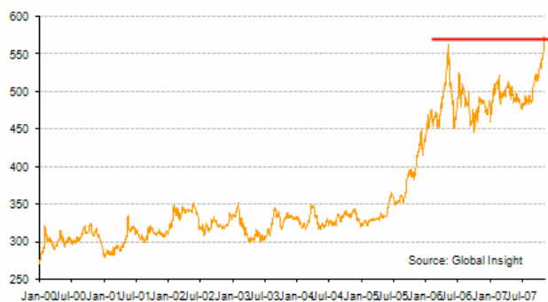
Gold price, Euro per ounce, London pm fix